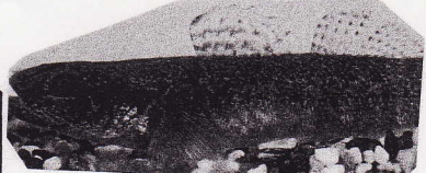
[オカワ] (ニラハエ) と言う